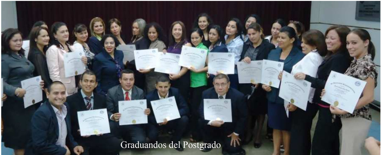
Graduandos del Postgrado

La Escuela Judicial en coordinación con la Universidad Hispanoamericana UHISPAM entregaron títulos de postgrado en Derecho de Familia a 45 profesionales del derecho en la ciudad de Managua.