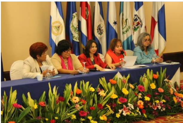
Devolución de resultados de las mesas de trabajo sobre el proyecto del Protocolo adicional al TISCA.