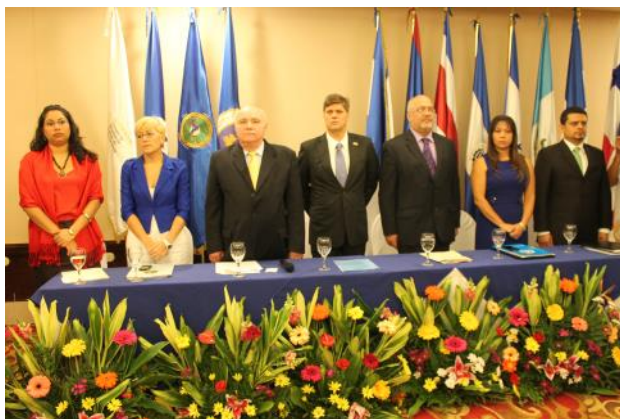
Clausura del III Encuentro Regional Integradas con Seguridad