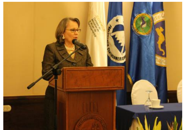
Lectura de la Declaración de Managua