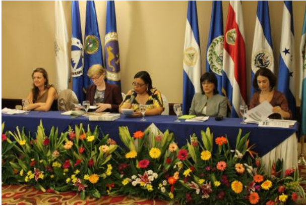
Panel de expertas de ONU Mujeres, PNUD y UNFPA.