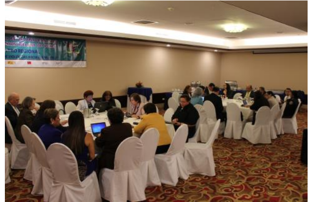
Mesas de trabajo sobre el proyecto del Protocolo adicional al TISCA.