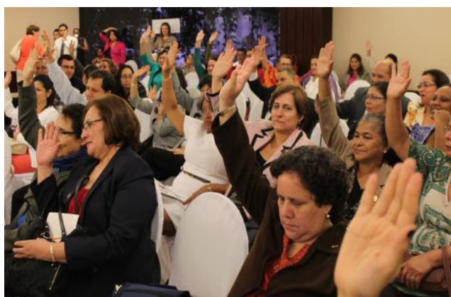
Asistentes votan la aprobación de la Declaración de Managua en plenaria

Mediante la Declaración de Managua, las instituciones también se comprometen a promover ante las instancias correspondiente del SICA el proyecto de Protocolo Adicional al Tratado de la Integración Social Centroamericana (TISCA) relativo a la prevención, atención, sanción y erradicación a todas las formas de violencia hacia las mujeres y restauración de sus derechos, presentado y debatido en este III Encuentro Integradas con Seguridad.