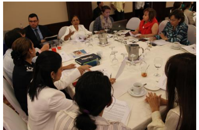
Mesas de trabajo sobre acciones para implementar el eje No. 5 de la PRIEG/SICA