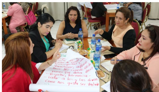
42 Secretarías de Género del Poder Judicial participaron en el primer taller del año organizado por la Secretaría Técnica de Género.

El taller contó con el apoyo de la Agencia Española de Cooperación Internacional para el Desarrollo (AECID), a través de su proyecto “Apoyo al fortalecimiento de capacidades del Poder Judicial en el ámbito de la seguridad jurídica, mediante la implementación y aplicación del Código Procesal Civil en el área jurisdiccional civil del Poder Judicial de la República de Nicaragua”.