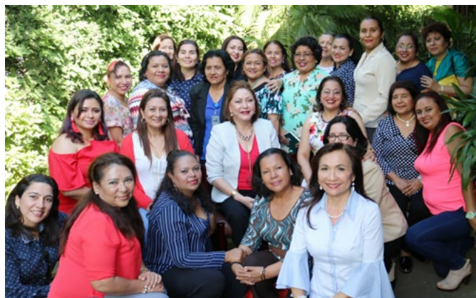
La Presidenta de la CSJ, magistrada Alba Luz Ramos Vanegas, se reunió con las Secretarías de Género de Managua con el objetivo de discutir las líneas de trabajo que se desarrollarán en este año.

“La Comisión de Género del Poder Judicial para este año se ha planteado continuar trabajando por la Igualdad de Género y seguir propiciando acciones que mejoren el clima organizacional, con especial énfasis en la promoción de un ambiente institucional respetuoso y digno, libre de acoso sexual y laboral, así mismo trabajar por relaciones familiares basadas en el respeto y la igualdad.”, destacó la Presidenta de la CSJ.