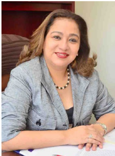
Magistrada Adda Benicia Vanegas Ramos, Presidenta de la Sala Penal Especializada en Violencia del Tribunal de Apelaciones de Managua.

“La Presidenta de la CSJ ha impulsado proyectos encaminados no solo a reformar el marco legislativo de nuestro país sino que a transformar la misma institución del Poder Judicial de cara a brindarles a las mujeres víctimas de violencia mayores herramientas para poder acceder a la justicia.”, señala la Magistrada Vanegas.