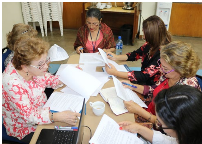
Trabajadoras sociales y psicólogas que integran los equipos interdisciplinarios de los Juzgados de Familia, durante el ejercicio de validación de su Protocolo de Actuación.

realizará un proceso de capacitación nacional, para que el instrumento sea usado de la manera más adecuada. Además, se elaboró un Protocolo de Actuación para los equipos interdisciplinarios de juzgados de Adolescencia y Violencia, los que serán validados próximamente.