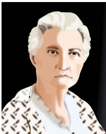
Josefa Toledo de Aguerri: Forjadora de la Pedagogía Moderna.

Josefa Toledo de Aguerri nació en Juigalpa en 1866 y es reconocida como la primera educadora de Nicaragua, forjando la pedagogía moderna en nuestro país con otras graduadas del Colegio de Señoritas, el que fue fundado en 1882.